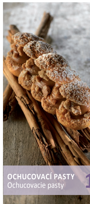
OCHUCOVACÍ PASTY Ochucovacie pasty