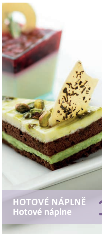
HOTOVÉ NÁPLNĚ Hotové náplne