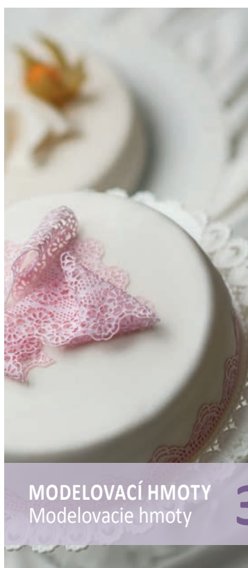
MODELOVACÍ HMOTY Modelovacie hmoty