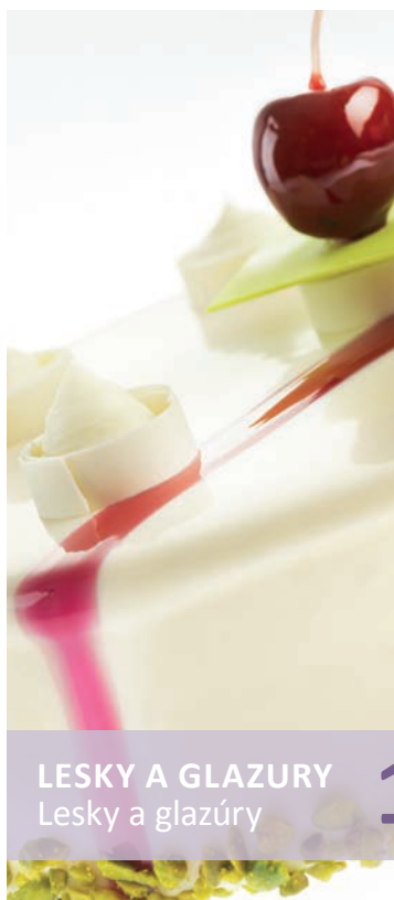
LESKY A GLAZURY Lesky a glazúry