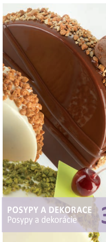
POSYPY A DEKORACE Posypy a dekorácie